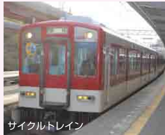
サイクルトレイン